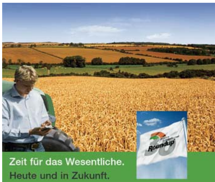
Blühende Landschaften –aussterbende Amphibien? Werbung von Monsanto